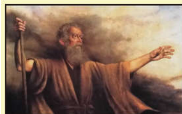
Sveti Malahija prorok

Ako šutiš – šuti iz ljubavi; ako govoriš – govori iz ljubavi; ako opominješ – opominji iz ljubavi; ako opraštaš – opraštaj iz ljubavi.