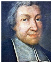
Ivan Krstitelj de la Salle

Rođen u Rheimsu, Francuska, 30.04.1651.g. u plemićkoj obitelji. Studirao je u Parizu i zaređen je 1678.g. Poznat je po svom radu sa siromašnima. Umro je u St-Yon, Rouen, na Veliki petak, 07.04.1719. Kanonizirao ga je papa Leo XIII 1900.g. Ivan je bio veoma aktivan na području edukacije. Osnovao je institut Braće kršćanskih škola (odobren 1725.g.), a osnivao je i fakultete za obrazovanje učitelja (Rheims 1687.g., Pariz 1699.g. i Saint-Denis 1709.g.). Bio je među prvima koji je pretpostavio razrednu nastavu pojedinačnom podučavanju. On je, također, jedan od prvih koji je počeo predavati na narodnom jeziku umjesto na latinskom. Njegove su škole bile osnivane po cijeloj Italiji. Papa Pio XII ga je proglasio zaštitnikom učitelja 1950.g.