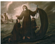
Sv. Franjo Paulski

Knjiga proroka Amosa sadrži u sebi čudesnu suvremenost, osobito u onim dijelovima u kojima šiba na bogoslužje koje se svelo na puku vanjštinu, bez sadržaja i duha. Prorok udara na lažnu sigurnost u vlastiti stav pred Bogom. Vrlo su suvremene i njegove socijalne misli. On je branitelj siromašnih i potlačenih.